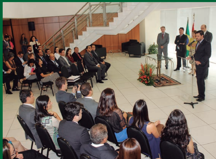
ANPT presente em todas as solenidades