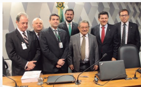
Senador Humberto Costa (PT-PE), líder do PT no Senado, esteve reunido com o grupo.