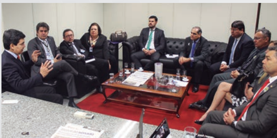
Senador Eduardo Amorim (PSC-SE) conversou com as entidades de classe;