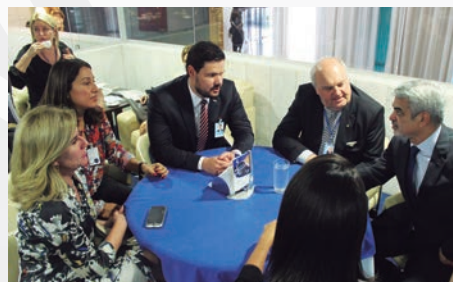
Frentas esteve reunida, diversas vezes, com o líder do PSDB no Senado, Cássio Cunha Lima (PSDB-PB)