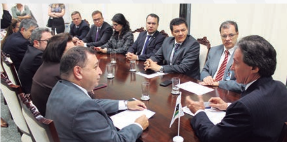
Grupo esteve reunido com o senador Randolfe Rodrigues (Rede-AP).