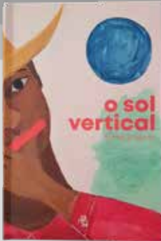
Título: O Sol Vertical Autor: Rafael Salgado Editora: Varanda