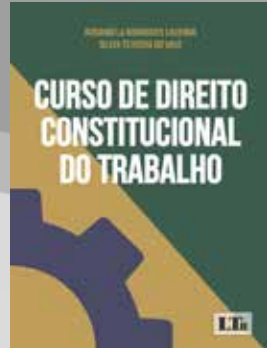
Título: Curso de Direito Constitucional do Trabalho Autoras: Rosângela Rodrigues Lacerda e Sílvia Teixeira do Vale Editora: LTR