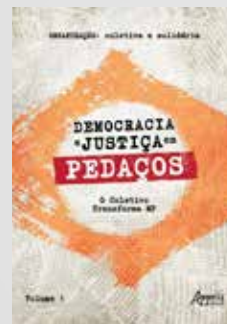
Título: Democracia e Justiça em Pedacos – O Coletivo Transforma MP Obra coletiva Editora: Appris